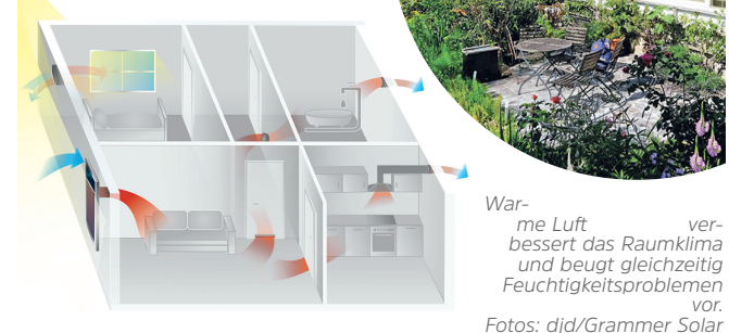
Warme Luft verbessert das Raumklima und beugt gleichzeitig Feuchtigkeitproblemen vor.

In Kellerräumen steht oft die Luft. Es herrscht ein muffiges, kammes Raumklima, in der Folge kann sich Feuchtigkeit ansammeln und zu weitergehenden Problemen wie einer Schimmelbildung führen. Umso wichtiger ist es, für eine stete Belüftung zu sorgen und am besten die einströmende Frischluft noch vorzuwärmen. Familie Streich aus Amberg ließ dazu in ihrem Eigenheim aus dem Jahr 1936 eine Solarluftanlage nachrüsten. Ein Solarkollektor an der Fassade gewinnt Energie, um frische Luft zu temperieren und ins Haus zu befördern. Damit arbeiten die Twinsolar-Systeme besonders umweltfreundlich und effizient, ohne laufende Betriebskosten. Zusätzlich ist eine staatliche Förderung von bis zu 25 Prozent möglich, unter www.grammer-solar.com finden sich mehr Informationen dazu. (djd)