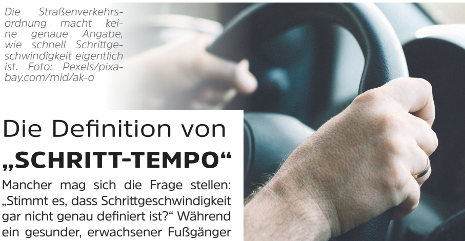
Die Straßenverkehrsordnung macht keine genaue Angabe, wie schnell Schrittgeschwindigkeit eigentlich ist.