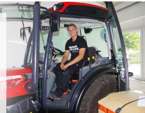
Bei mechatronischen Berufen stehen Wartung und Reparatur von Garten- und Outdoorgeräten im Mittelpunkt.

ten Ausbildung bieten Motoristenbetriebe ihren Azubis bei einem erfolgreichen Abschluss attraktive Perspektiven – angefangen von einer Übernahme bis hin zu vielfältigen Weiterbildung- und Aufstiegschancen. „Ob Vier-Tage-Woche oder doch lieber Karriere bis hin zur Selbstständigkeit, die Motoristenbranche hält viele Chancen bereit“, so Oliver Hütt weiter. Da gut jeder vierte Betrieb in den nächsten fünf bis zehn Jahren einen Nachfolger oder Geschäftsführer suche, seien die Karriereperspektiven sehr gut. Unter www.greenbase.de etwa gibt es mehr Details dazu, zudem lassen sich hier örtliche Motoristenbetriebe finden. Ein Praktikum