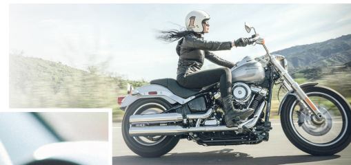
Nach der Winterpause sollte Mann oder Frau nicht ohne Vorbereitung in den Sattel steigen.

Dabei wird geprüft, dass sämtliche Komponenten intakt sind und alle Funktionen zur Verfügung stehen.