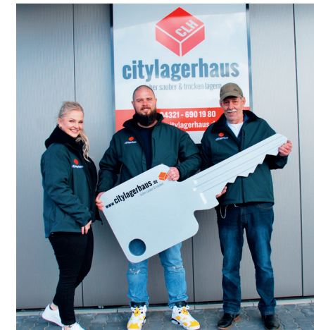
Das Citylagerhaus-Team in Neumünster: symbolische Schlüsselübergabe zur Eröffnung am 16.03.2024