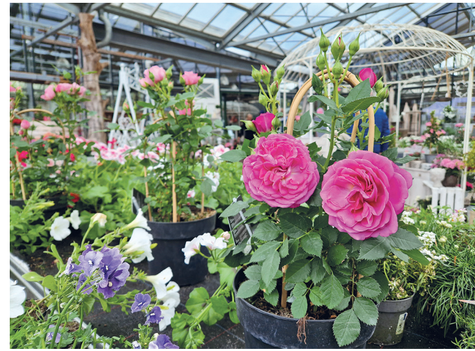
Auf dem Frühlingsfest des Pfauenhofs erwarten die Besucher farbenfrohe Blumen für Balkon und Garten sowie schöne Dekorationen, die Lust auf Frühling machen. Foto/Text: Pfauenhof

Beim Frühlingsfest auf dem Pfauenhof kommt auch das leibliche Wohl nicht zu kurz: Vom Grill bis hin zum Suppentopf ist für jeden Geschmack etwas dabei, selbstverständlich auch für Vegetarier. Die Witorfer Brauerei schenkt verschiedene Sorten Craftbier und selbstgebraute Brause aus. Kaffee und Kuchen aus dem Verkauf des Vereins der Lebenshilfe Neumünster runden die Angebote ab.