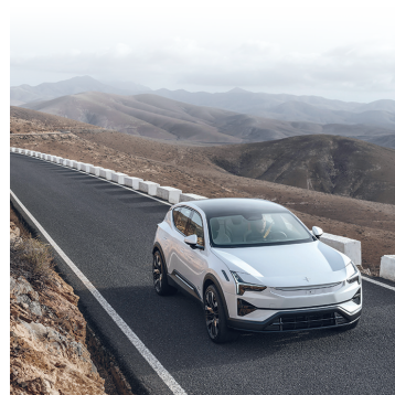
Weil Strom wie bisher deutlich günstiger bleibt als Benzin oder Diesel, können auch die Betriebskosten bei rein batteriebetriebenen E-Fahrzeugen erheblich niedriger ausfallen als bei Benzinern oder Dieselfahrzeugen.

werden erheblich weniger Teile überprüft. Bei den Reparaturkosten kommt es unter anderem darauf an, ob der Anbieter eine langjährige Garantie für die Batterie abgibt. (djd)