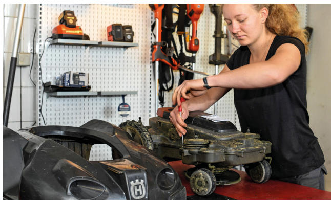
Die praxisnahe Ausbildung eröffnet reizvolle berufliche Perspektiven bis hin zur Selbstständigkeit.