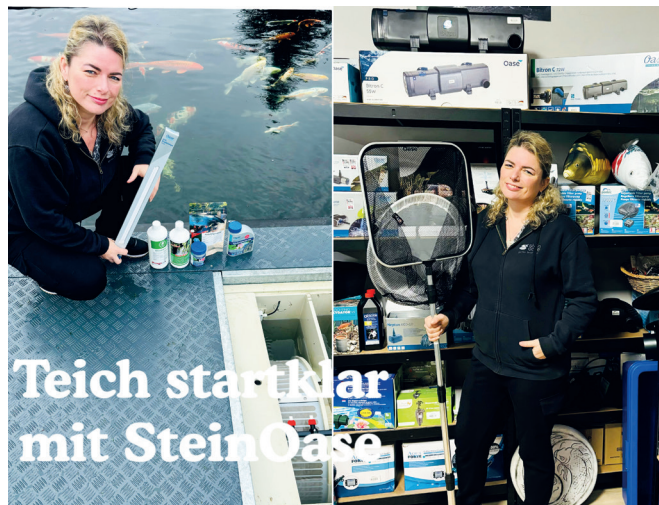
Teich stark klar mit SteinOase

Die Ankunft des Frühlings markiert den Beginn einer neuen Saison für Teichliebhaber. Es ist die Zeit, sich vorzubereiten, um die Außenbereiche wieder zum Leben zu erwecken und ihre Gewässer zu pflegen. Von