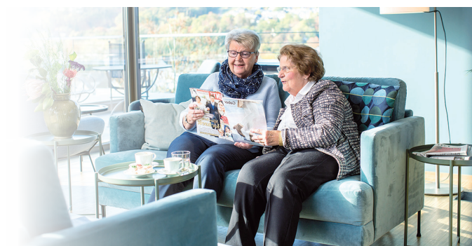
Im richtigen Umfeld fühlen sich Senioren schnell zuhause.